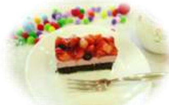
フルーツたっぷりのクリスマスケーキでした