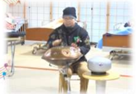
神秘的な音色が響きました♪

終了後はゲストを招いて、ガンクドラムを演奏していただきました。ガンクドラムは最近の楽器であり、神秘的な音が室内に響きました。実際に楽器に触れる機会もあり、貴重な体験になりました。これからも、合唱サークルは新しい事に挑戦し続けていきたいと思っています。