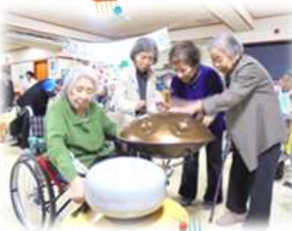
初めて触れる楽器に皆さん興味津々!!