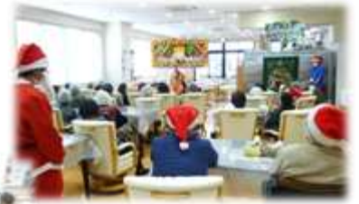
サンタクロースの登場に思わずにっこり♪