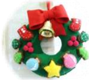
本格的な、かわいらしいリースが完成しました!