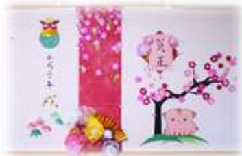
壁飾りでお正月の雰囲気を楽しんでいただいています

「新年明けましておめでと〜ございませ〜」の挨拶と共に2018年がスタートしました。おせち料理を食へながら「今年も楽しくしていかなばね」「今年もがんばろうね」等、入居者様同士で楽しくお話されていきました。スタッフ一同も気持ちを持ち新たに引き締め、入居者様の生活が笑顔いっぱいになるようお手伝いしていけたらと思います。今年もどうぞよろしくお願いいたします。