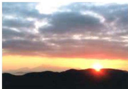
琴の尾岳より雲仙普賢岳 初日の出