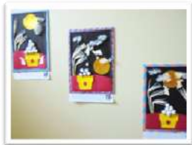
お月見とうさぎの貼り絵 それぞれの個性が光ります