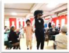
お孫さんの飛び入り参加に大盛り上がり！

披露曲は「子連れ狼」、「赤胴鈴之助」、「銭形平次」など、入居者様もよくご存知の歌が多く、ロずさんだり手拍子を打ったり、大変満足されていたようです。 「次は職員によるヒゲダンスです！」の声と共に、聞き覚えのある曲が流れてきました。ヒゲダンスといえばザ・ドリフターズのダンスですが、曲にあわせてヒゲを付けた職員が、所狭しと走り回りました。ご家族の飛び入り参加もあり、普段とは少し違うコミカルな職員の姿に皆様から拍手喝采が湧き上がりました。