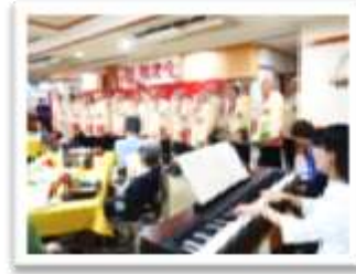
迫力のある歌声が会場に響きました

余興の第一弾は長崎アカデミー男声合唱団の皆様が歌を披露してくださいました。長崎にも本格的な男性合唱団を作ろうと中学校の先生を中心に十数名で結成され、現在は団員が65名。その中から厳選された約25名のメンバーが来てくださいました。