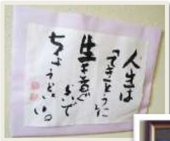
素晴らしい書と 言葉です！