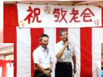
各部署の紹介が行われました