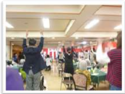
ますますのご長寿を願って バンザイ！！