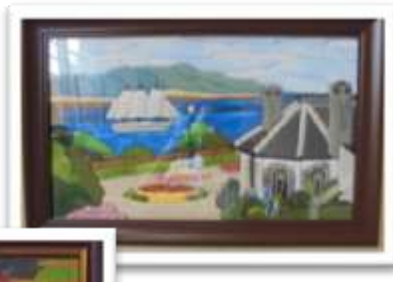
木目込みという手法で 作られた作品です